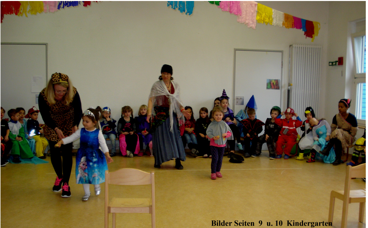
Bilder Seiten 9 u. 10 Kindergarten

Das ganze Jahr über verkleiden sich die Kinder gerne und spielen im Rollenspiel Erlebtes nach. Deswegen übt die Fastnacht auf die meisten Kinder eine besondere Faszination aus. An Fastnacht darf man sich ein Kostüm aussuchen und in verschiedene Rollen schlüpfen, mit dieser Verkleidung macht es noch mehr Spaß.